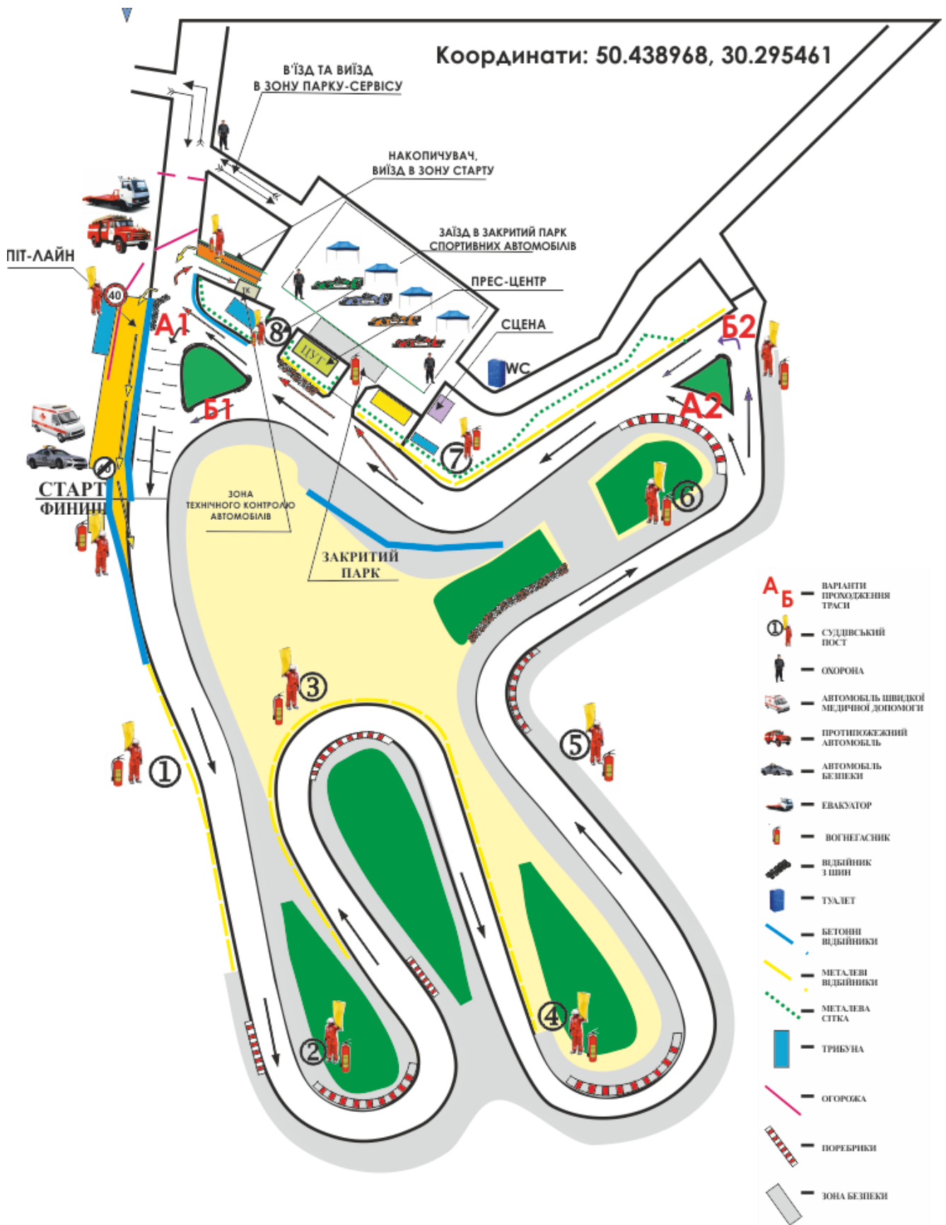
СХЕМА ТРАСИ ЗМАГАННЯ